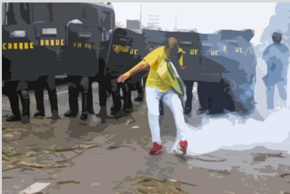
Figura 5 – Porrada, Tiro e Bomba. Adaptado de UOL.

A multidão, ensandecida e motivada pelo que foi dito nas caixas de som maiores que os edifícios de Jardim da Penha, marchou em direção aos políticos, e o Batalhão de Choque já ficou em alerta, vendo aquela multidão vindo em sua direção, todos apontaram suas armas de bala de borracha, e dispararam contra os enganados cidadãos, iniciando uma sessão de violência que se desdobrou igual peças de dominó enfileiradas, quando se derruba a primeira – repercussões exponenciais, cujos detalhes não quero lamentavelmente detalhar.