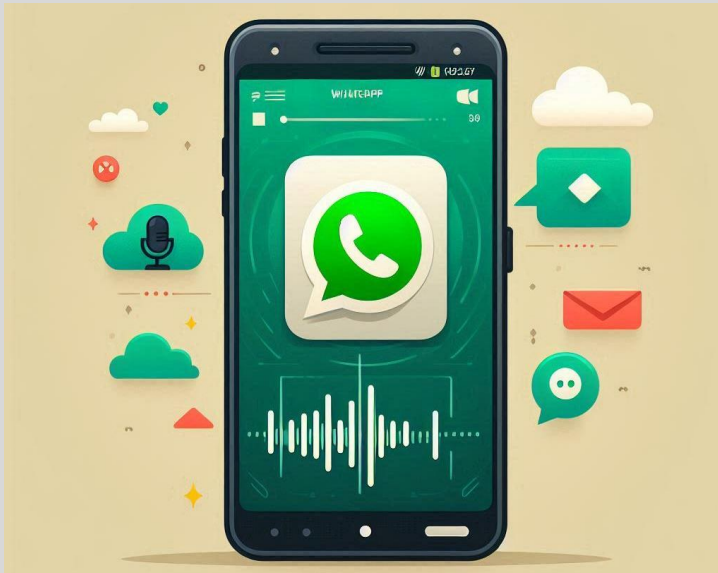
Figura 9 – Um áudio chega no Whatsapp do Advogado Ronaldo.

- Sou deficiente auditivo, você pode escrever para mim?