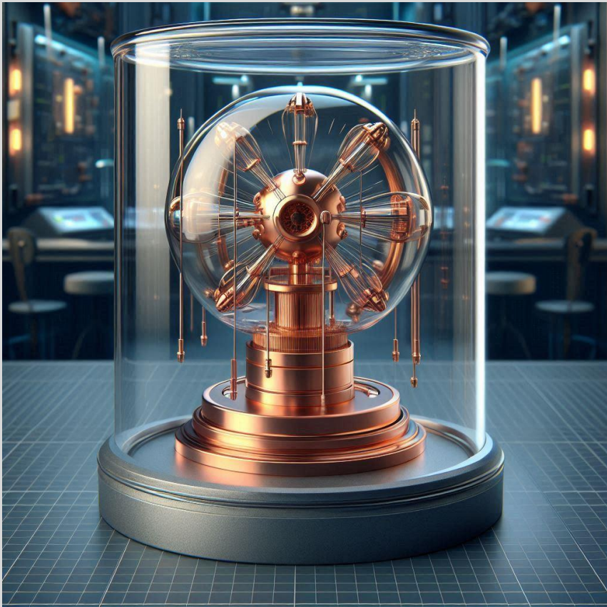
Figura 6 – O Motor que foi furtado pq o Vigia que deveria vigiar não vigiou

Depois de 42 dias de apuração, descobriram que uma peça de 2,8kg de cobre puro foi furtada às 4:17 da madrugada da noite anterior à inauguração do Metrô e ninguém percebeu, porque o vigia designado para fazer a segurança de justamente esta peça dormiu em serviço. Ou seja, o vigia que deveria vigiar, não vigiou.