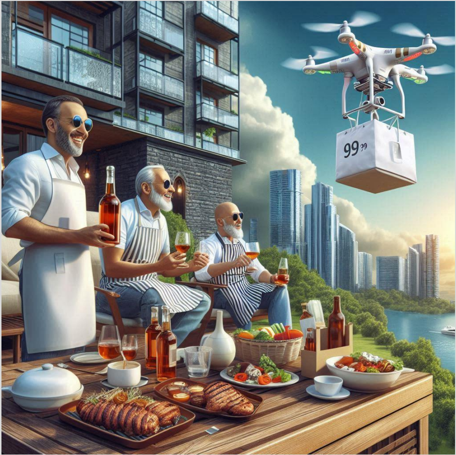
Figura 7 – Continue lendo o texto para saber do que se trata.

implantação de um sistema inovador que vai garantir que o seu porteiro ou vigia noturno não dê aquela famosa pescada, ou cochile, ou aproveite que ninguém está vendo e até durma. Porque a partir do momento que, independente do motivo, o seu profissional perder o foco e pestanejar, a segurança de todos os moradores está em jogo.