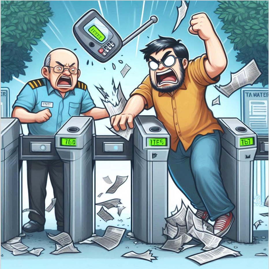
Figura 3 – O povo revoltado quebra as catracas do Metrô

As pessoas começaram a sair, alguns revoltados quebrando os bancos, outros lá fora derrubando os alambrados, e invadindo o meio de campo, outros vândalos quebraram as catracas eletrônicas e a revolta (como um inconsciente coletivo) se alastrou, como se Dagon (o deus dos filisteus) tivesse passado uma de suas asas por ali e o inferno se instalou.