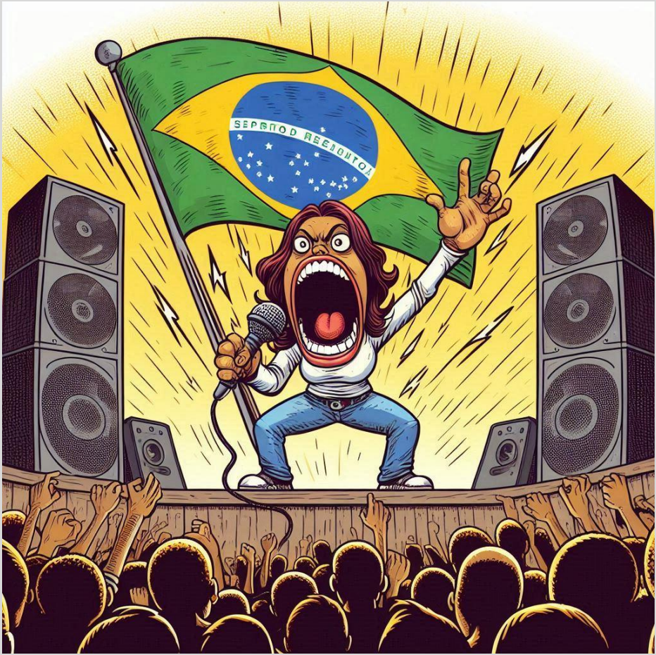
Figura 4 - Uma cidadã capixaba, revoltada, pegou o microfone e gritou!

Alguém muito irritado – com a devida razão – subiu no palco utilizado para cerimônia de abertura em que os políticos passaram horas lambendo os sacos uns dos outros e pegou o microfone e disse algo que foi recebido por todos como um convite para comer algo tão gostoso quanto Frutas com Mel e Sucrilhos. Ela gritou: - VAMOS MATAR ESSES POLÍTICOS LADRÕES!!! – e saiu correndo.