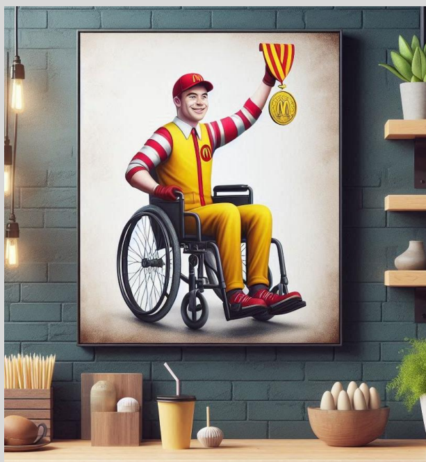
Figura 12 – Funcionário PCD é eleito o melhor do Ano no MC Donalds.

Empresas quebram por mal atendimento. Grandes Restaurantes de Beira de Estrada quebram também, não pelo fato de ser tudo maravilhoso, mas pelo fato de o banheiro feder a mijo, mesmo estando aparentemente limpo.