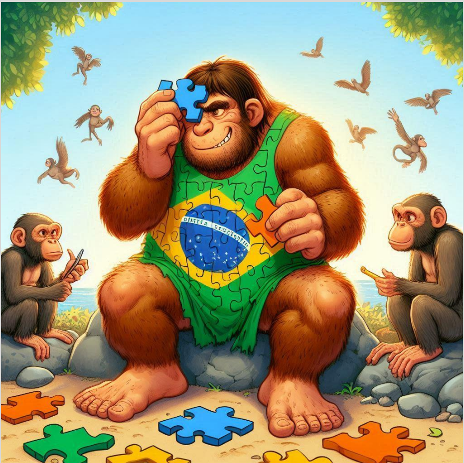
Figura 2 – O Quebra-Cabeça dos Neandertais Brasileiros

Voltando: Estavam todos filmando ou transmitindo ao vivo, né?, a inauguração da porra do Metrô construído pelos homens da idade da pedra lascada brasileiros (os Neandertais que nem tinham dominado o fogo e que pelo fato de terem saído das cavernas são a eles atribuído o salto quântico de evolução, só por terem saído da caverna).