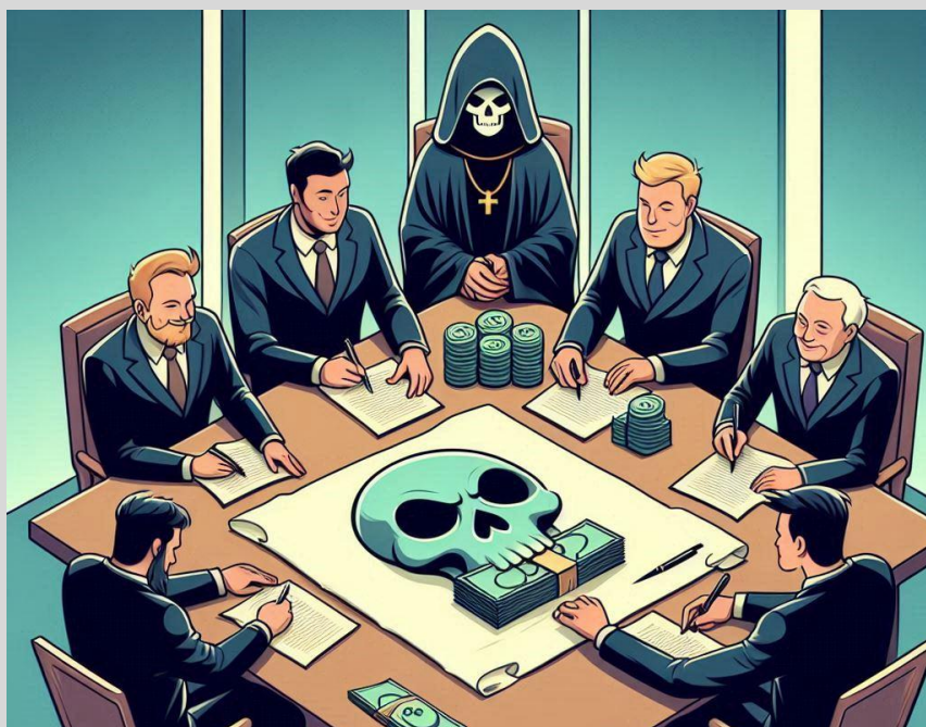
Figura 10 – Senhores do Mundo se reúnem para matar os trabalhadores

processo vira meu. Para você não ficar chupando dedo, eu te dou uma simbólica comissão, um consolo, para evitar que você more na rua ou morra de fome. Não é uma proposta boa?