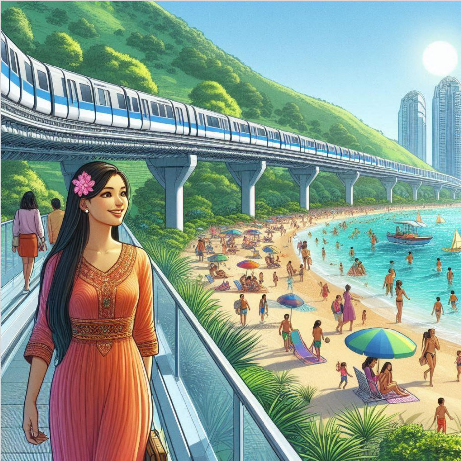
Figura 1 – O tal Metrô do Governador

O projeto era inovador no Brasil. Tecnologia Japonesa, trilhos flutuantes, magnéticos, movidos a energia solar, 100% sustentável, não emite gás carbônico, não queima combustíveis fósseis, não poluiria o meio ambiente e até os dejetos dos sanitários seriam tratados antes de serem despejados nos ecossistemas.