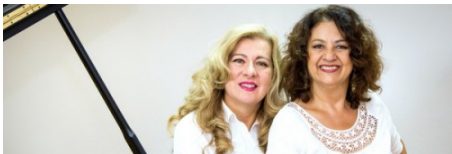
Música contemporânea feminina em Campinas