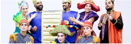
"O Reino de Duas Cabeças", ópera de Jaceguay Lins