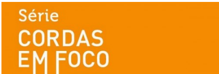
Beethoven, Mozart, Brahms e Kreisler para violino e piano