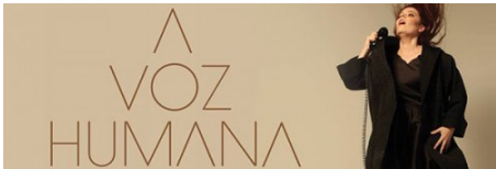
Club Noir apresenta "A Voz Humana", de Poulenc